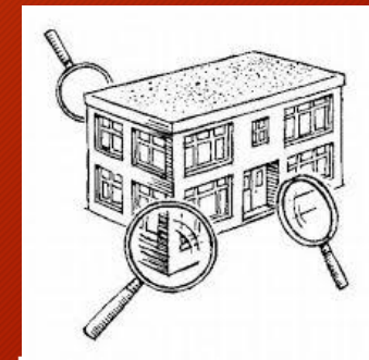
Praktijk onderzoek andere scholen